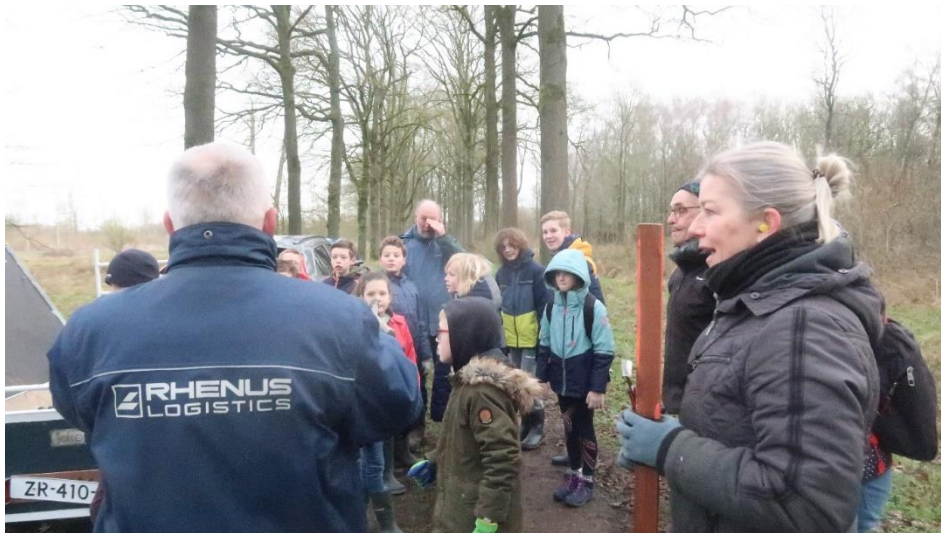
Snoeien in de Keel

Aan het einde van 2023 hadden we 18 leden.