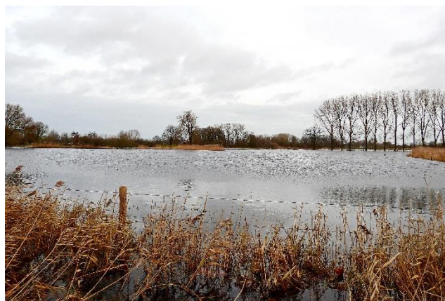
Hoog water Den Hulst

De coördinator van de werkgroepen staat vet gedrukt