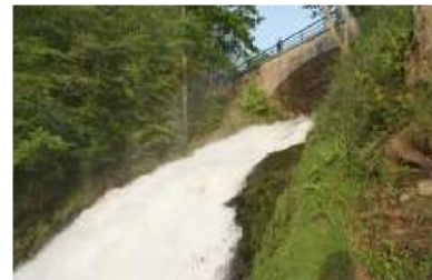
Waterval van Coo

Er zit vis op het stuwmeer, ik denk karpers. De meidoorn, die staan er volop, staat mooi in bloei