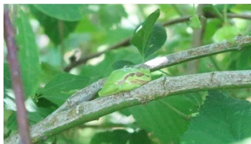
Boommikkertje in de Mortelen