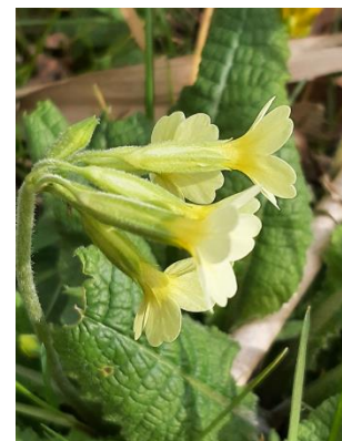
Slanke sleutelbloem in de Rouwboimmel