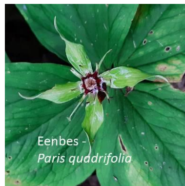
Eenbes - Paris quadrifolia