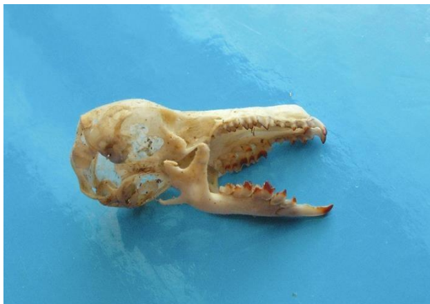
Schedel waterspitsmuis

Je kunt aan de hand van de gevonden aantallen het landschap lezen.