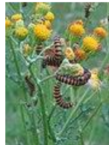
Jacobskruiskruid met rupsen langs het Duits lijntje